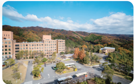
近畿大学和歌山キャンパス (生物理工学部)